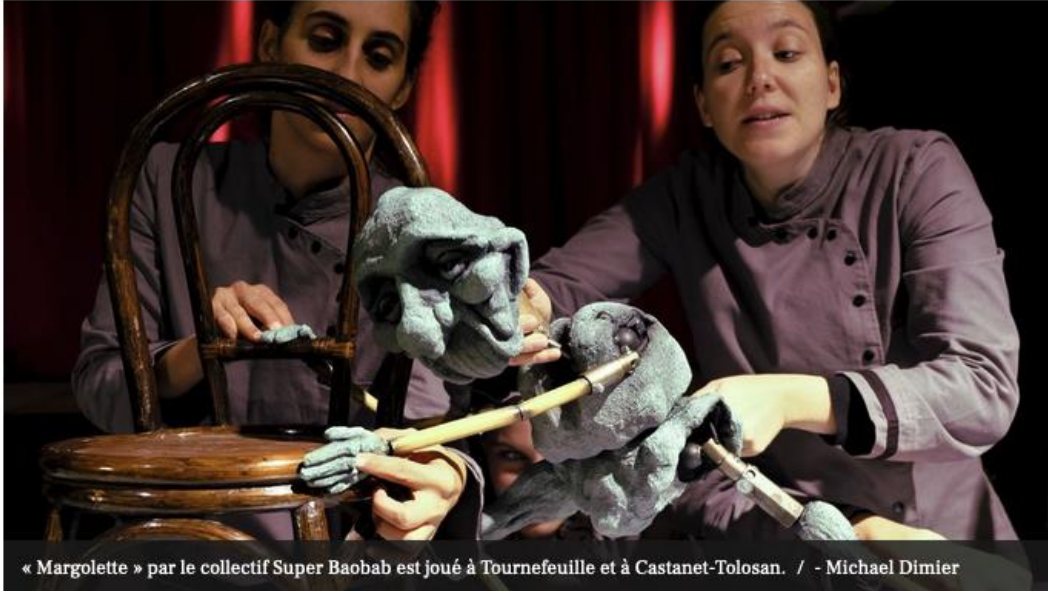
« Margolette » par le collectif Super Baobab est joué à Tournefeuille et à Castanet-Tolosan.