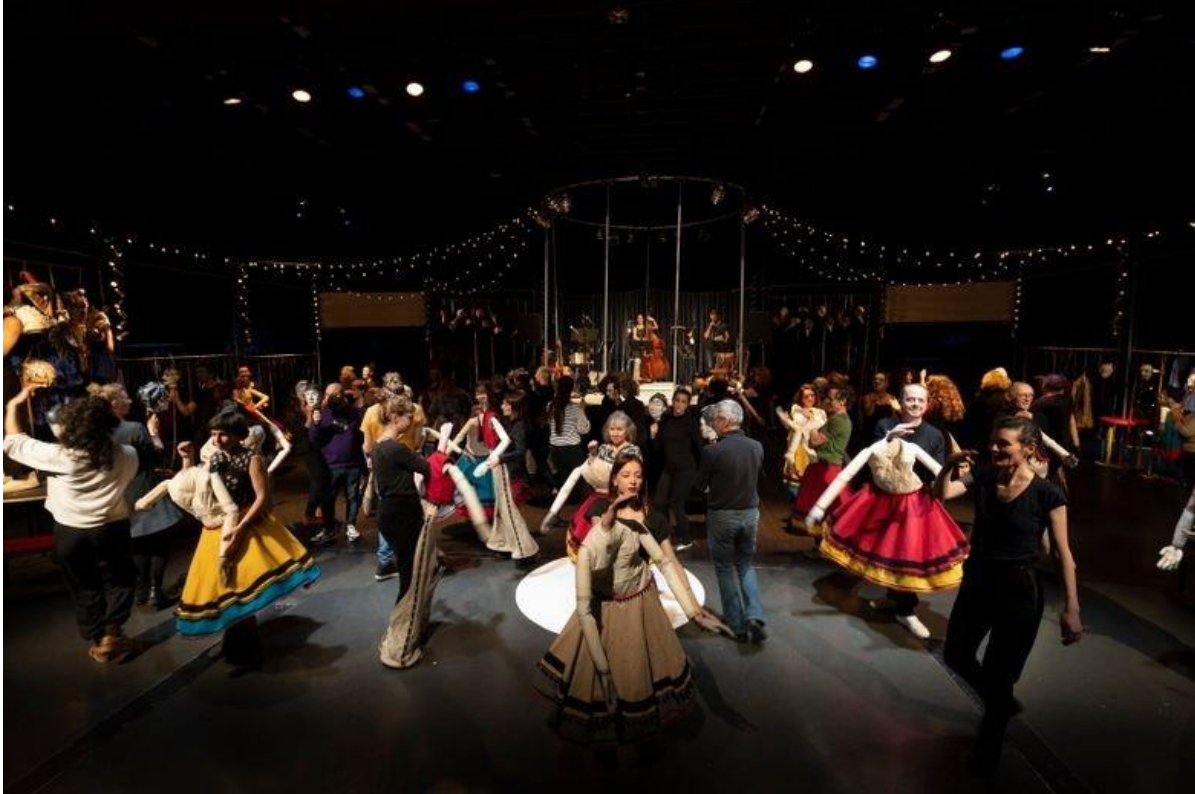
"Le bal marionnettique" - Cie Les Anges au plafond, spectacle participatif au festival 2022