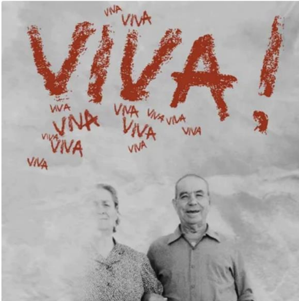
Affiche du spectacle VIVA! • © La Loquace Cie

Parmi la multitude de spectacles captivants proposée cette année, VIVA! Se distingue comme un des incontournables de cette édition 2023. Alliant habillement des compétences techniques, des émotions intenses et un récit captivant, ce spectacle est une invitation à plonger dans un monde où la magie du théâtre d'objet opère à son apogée.