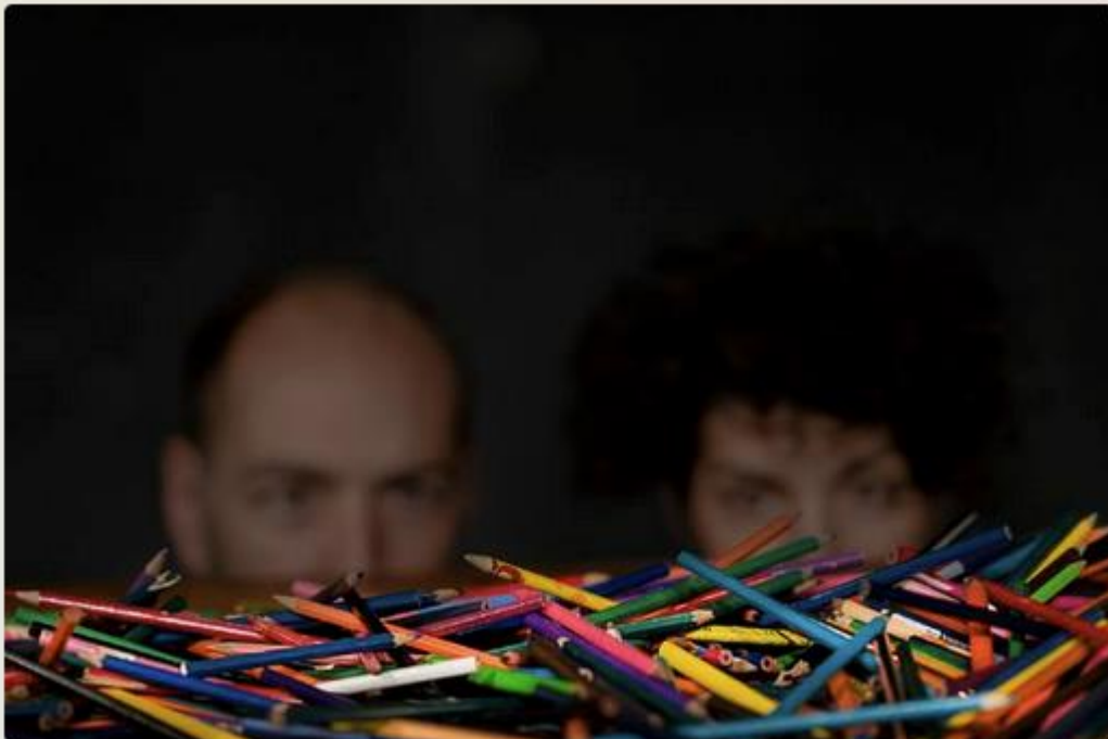
Le spectacle "VIVA!" de la compagnie "La loquace Compagnie", au festival Marionnettissimo, du 21 au 26 novembre 2023